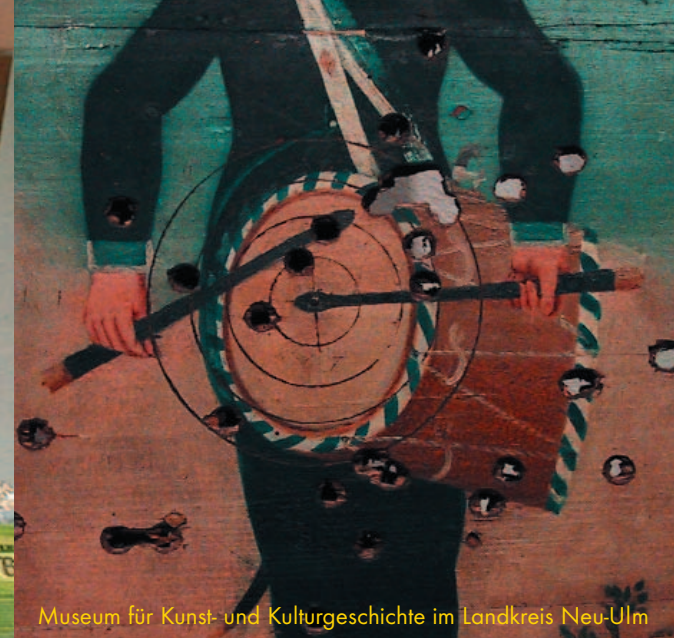
Museum für Kunst- und Kulturgeschichte im Landkreis Neu-Ulm

Das reiche Erbe an Werkzeugen rühren hat uns überrascht.